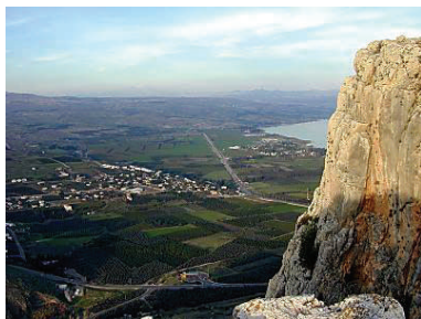
Blick vom Arbel auf den See Genezareth

Bei dieser „Geistlichen Zeit in Israel“ wird daher neben der Besichtigung der jeweiligen Orte Zeit sein für Schriftlesung, Schriftgespräch, Meditation, Gebet, Bibliodrama und Zeit zur freien Gestaltung. Durch die „Erdung“ von Ort und biblischer Geschichte wird die Botschaft der Texte für unseren Glauben lebendig werden.