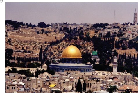
Tempel in Jerusalem

„Und das Wort ist Fleisch geworden - zeltend unter uns“