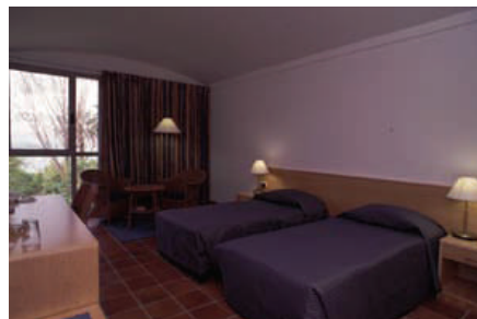
Zimmer im Pilgerhaus in Tabgha