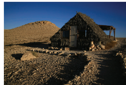
Succah-Hütte in der Wüste