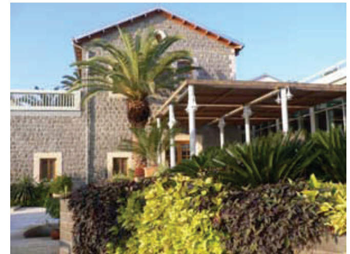
Pilgerhaus in Tabgha